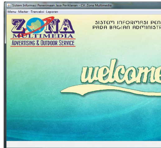
Gambar 3.1.1. Tampilan Menu Utama Setelah Login

Jika login benar, maka menu utama akan tampil seperti gambar 3.1.1 dan pilihan menu pun akan diaktifkan menjadi enable.