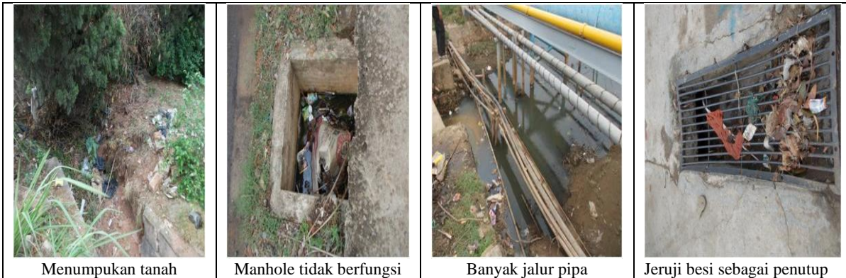
Menumpukan tanah Manhole tidak berfungsi Banyak jalur pipa Jeruji besi sebagai penutup

Tidak jauh berbeda dengan dibagian seberangnya saluran drainase yang bergabung dengan gorong – gorong kolam retensi Rumah Sakit Siti Khodijah keadaannya cukup parah. Saluran yang terkesan asal jadi, dipenuhi sampah, ukuran saluran yang terlalu kecil, dan instalasi pipa dan slang yang mengganggu aliran drainase.