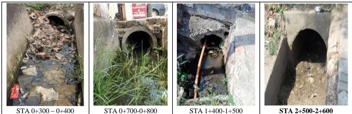
Gambar 3. Kondisi Saluran Samping di Beberapa STA.

Tidak hanya saluran yang sudah rusak dan tidak dirawat di beberapa titik terdapat gorong – gorong yang sudah ditumpuki sedimen dan sampah. Berikut adalah beberapa keadaan gorong – gorong hasil pengamatan dari simpang SMA 10 s/d Simpang Polda.