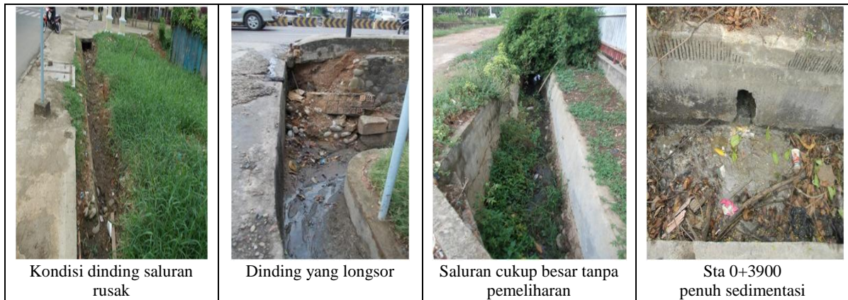
Gambar 6. Kondisi Saluran Drainase dan Permasalahannya

Kondisi saluran yang hancur dan ditumbuhi tanaman liar juga terjadi pada STA 2+400 dan STA 3+000. Di sebuah simpang di STA 3+200 tidak terdapat drainase bahkan gorong – gorong juga tidak ada. Selain itu terdapat juga gorong – gorong yang bermasalah sudah tersumbat oleh tanaman liar dan sampah pada STA 3+300. Sampah – sampah tersebut bukan hanya karena sampah yang memang terbawa oleh aliran drainase tetapi warga yang memang memakai tempat itu untuk membuang sampah. Gorong – gorong ini berguna untuk mengalirkan air yang berada di sebrang ke sebuah kolam yang berada di belakang perumahan Brimob