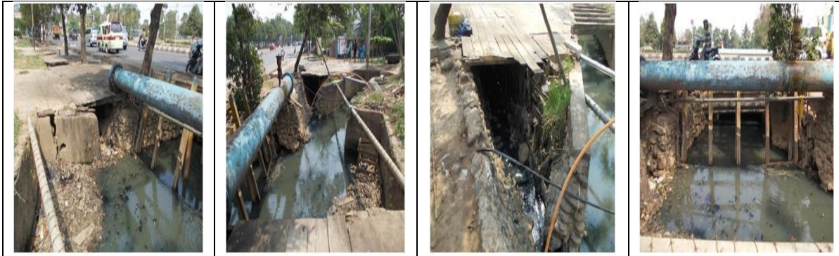
Gambar 4. Kondisi saluran drainase dan gorong – gorong yang terhubung ke kolam retensi Di Samping Rumah Sakit Siti Khodijah

terbuat dari batu kali dan tidak di plester diperparah lagi oleh sedimen dan sampah yang menumpuk, hal ini disebabkan pedagang yang berjualan membuang sampah sembarangan disini pada malam hari.