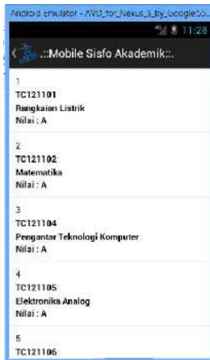
Gambar 6 Halaman Transkrip Nilai

Menu ini digunakan untuk melihat daftar transkrip nilai yang terdiri dari informasi kode, nama matakuliah dan nilai yang diperoleh. Informasi halaman transkrip nilai dapat dilihat pada Gambar 6. Pada bagian kiri atas terdapat satu buah tombol berupa anak panah menghadap ke kiri (<) yang digunakan untuk kembali ke halaman menu utama.