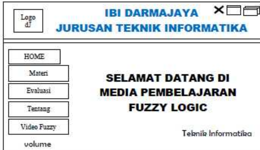
Gambar 4 Tampilan Rancangan Menu Utama

Tampilan rancangan menu utama dapat dilihat pada Gambar 4.