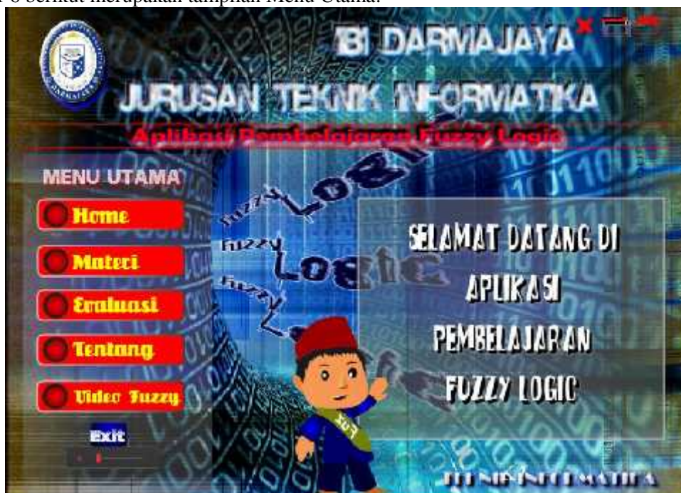
Gambar 6 Tampilan Menu Utama

Berikut menguraikan tampilan aplikasi pembelajaran Fuzzy Logic berbasis multimedia. Gambar 6 berikut merupakan tampilan Menu Utama: