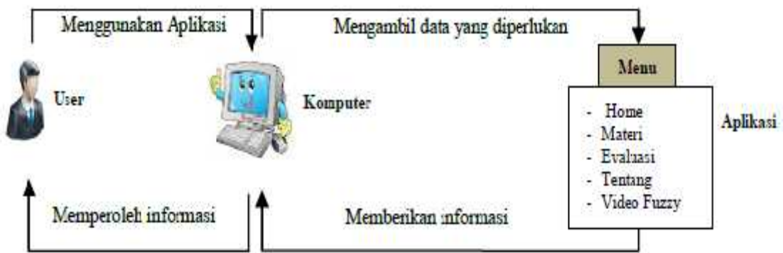
Gambar 2 Arsitektur Sistem yang Digunakan

Sistem memiliki 2 (dua) aktor yaitu mahasiswa sebagai end user dan dosen sebagai supporting system . Use case diagram dapat dilihat pada gambar 3.