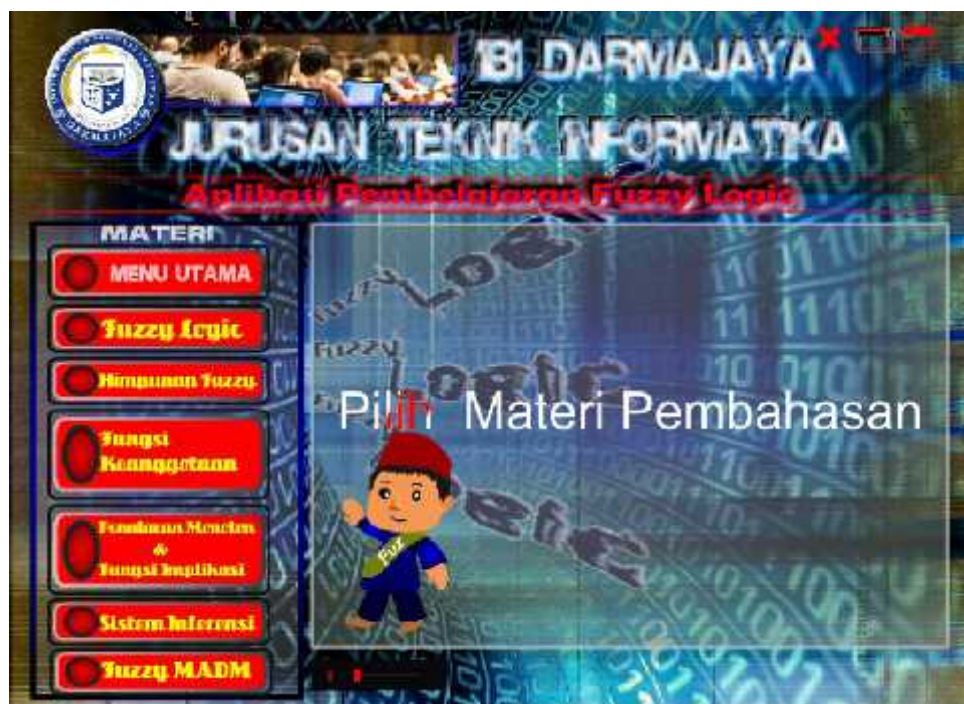
Gambar 7 Tampilan Menu Materi

Menu materi ini berisi materi yang terdiri dari konsep himpunan fuzzy, fungsi keanggotaan, penalaran monoton, fungsi implikasi, sistem inferensi, fuzzy MADM.