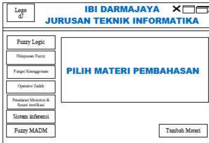
Gambar 5 Tampilan Rancangan Menu Materi

Tampilan rancangan menu materi seperti pada tampilan Gambar 5.