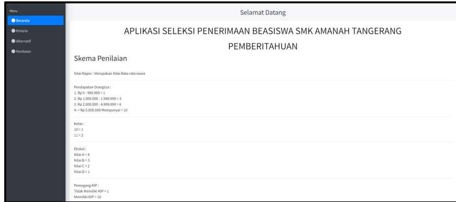
Gambar 3. Tampilan Awal

Pada gambar 4 menampilkan halaman antarmuka setelah melakukan proses login , dimana proses login berhasil.