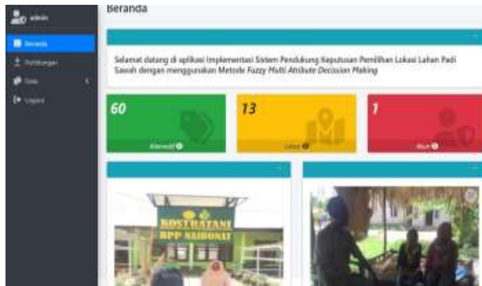
Gambar 3. Halaman Dashboard

Hasil dari perancangan sistem ini ialah terciptanya sebuah website yang dapat membantu penyuluh dan petani maupun masyarakat dalam pengambilan keputusan penentuan lokasi lahan padi sawah tadah hujan menggunakan metode Fuzzy MADM. Hasil implementasi sistem dapat dilihat pada gambar 3