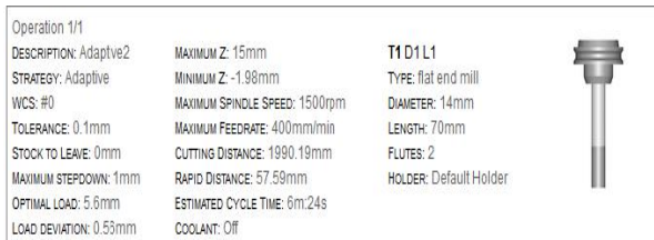
Gambar 3. Cutter Tool