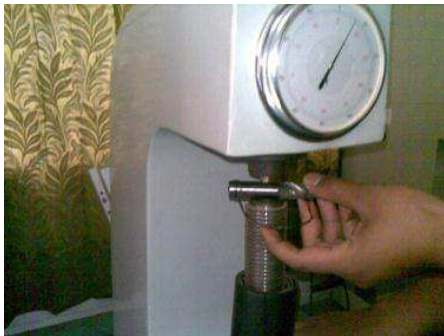
Gambar 1 : Pengujian kekerasan dengan mesin Rockwell sebelum di Heat Treatment

Pada hasil pengujian ini didapatkan bahwa adanya perbedaan sifat kekerasan bahan Cutter milling HSS sebelum dan sesudah proses Heat treatment dan proses quenching dengan media air garam 6%, 8% dan 10%.