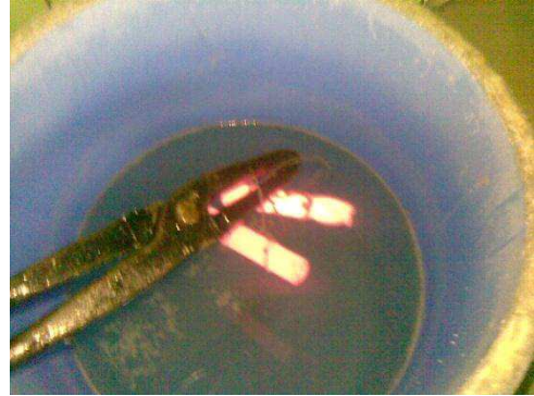
Gambar 3 : Benda uji dicelupkan ke media air garam setelah di Heat Treatment