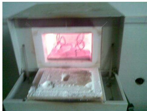
Gambar 2 : Benda uji dipanaskan dalam dapur Heat Treatment