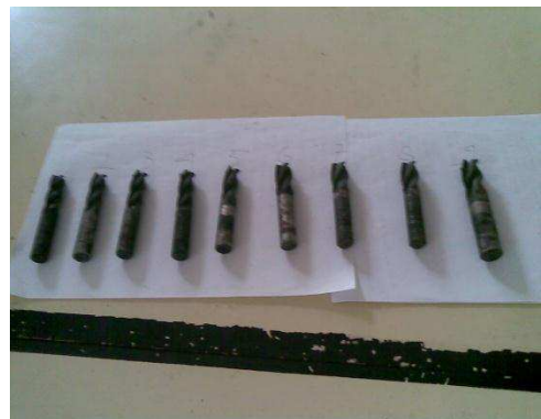
Gambar 4 : Benda uji setelah dicelupkan ke media air garam