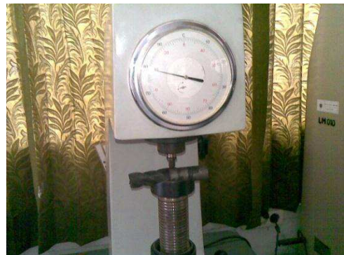
Gambar 5 : Pengujian dengan mesin Rockwell setelah di Heat Treatment dan quenching