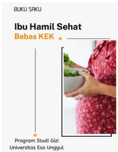
Gambar 1. Buku Saku

Informasi yang tepat dan mudah diakses adalah kunci untuk mendorong perubahan perilaku. Tujuan utama kami adalah untuk memastikan bahwa setiap ibu hamil yang menerima buku saku ini dapat memahami dan menerapkan pengetahuan yang didapat dalam kehidupan sehari-hari mereka.