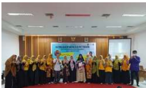
Gambar 6. Foto Bersama Dengan Penitia, Pemateri, dan Peserta Pelatihan

Kegiatan pelatihan berjalan dengan lancar dimulai dari pembukaan sampai dengan penutupan. Peserta pelatihan mempraktekkan langsung dengan menggunakan laptop yang peserta bawa masing-masing. Walaupun terkendala vasilitas komputer dan tidak menggunakan meja dan hanya duduk beralaskan karpet, peserta terlihat aktif dalam tanya jawab dengan pemateri sehingga pemateri dapat melihat atau memantau langsung kemampuan peserta dalam membuat buku cerita bergambar.