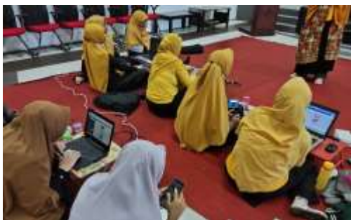
Gambar 5. Praktek Membuat Pictbook Menggunakan Aplikasi Canva

Peserta dari komunitas Guru Kreatif Suka Menulis Kalimantan Timur sangat antusias mengikuti pelatihan ini, dapat dilihat pada gambar 5 dan 6 dibawah ini