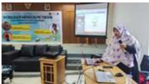
Gambar 3. Pemateri Menjelaskan Pengenalan Aplikasi Canva