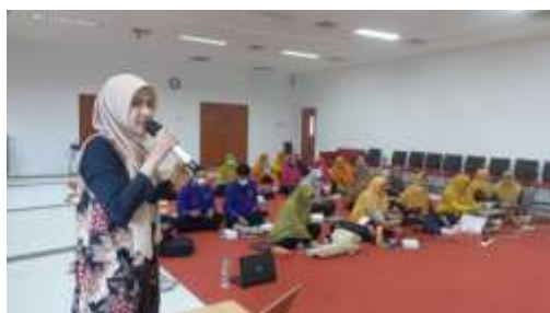
Gambar 4. Pemateri Menjelaskan Cara Kerja Menggunakan Aplikasi Canva

Peserta dari komunitas Guru Kreatif Suka Menulis Kalimantan Timur sangat antusias mengikuti pelatihan ini, dapat dilihat pada gambar 5 dan 6 dibawah ini