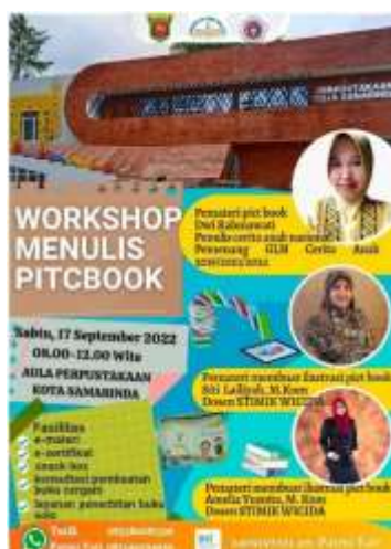
Gambar 1. Flyer Pelaksanaan Pelatihan dan Workshop Menulis Pictbook