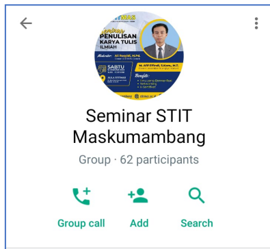
Gambar 1. Capture WhatsApp Group untuk Peserta Seminar

Peserta diminta untuk bergabung ke dalam Grup WhatsApp (Gambar 1). Hal ini untuk memudahkan dan menjaga interaksi antara pemateri dan peserta. Grup WhatsApp antara lain dimanfaatkan untuk mengirimkan URL Pretest dan Postest, serta pengiriman URL Padlet dan kisi-kisi tulisan perkenalan yang harus disusun mahasiswa peserta.