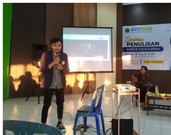
Gambar 2. Dokumentasi Sesi Penyampaian Materi

Di tengah sesi penyampaian materi, pengabdian mengajak partisipasi peserta dengan cara melakukan simulasi menulis. Simulasi yang dirancang agar semua mahasiswa peserta dapat mengenalkan dirinya secara tertulis. Tahapan pertama pada sesi ini pengabdian memperkenalkan outline tulisan perkenalan mahasiswa peserta, meliputi nama lengkap, program studi, alamat, serta hobi. Tahapan kedua, penulis memperkenalkan akses penggunaan Padlet. Seluruh peserta membawa smartphone yang berisikan paket data, sehingga dimanfaatkan dalam sesi ini untuk berinteraksi menulis. Pengabdian menunjukkan akses dan cara menulis menggunakan Padlet menggunakan Smartphone.