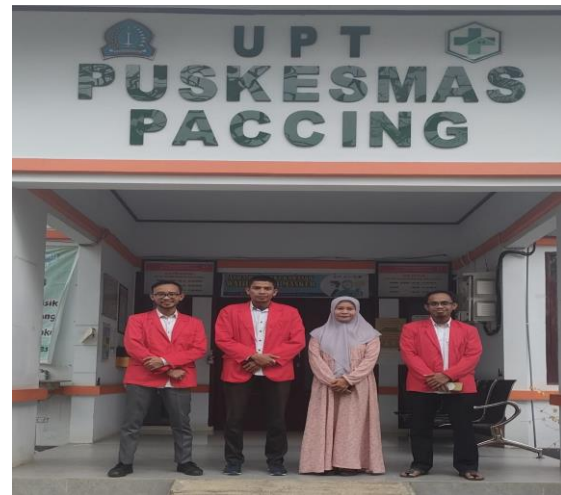
Gambar 1. Survei lokasi Pengabdian Kepada Masyarakat Bersama Salah Satu Pegawai Puskesmas.

Pada tahapan ini Akademi Keperawatan Batari Toja melalui Unit Penelitian dan Pengabdian Kepada Masyarakat melakukan koordinasi melalui Kepala Desa dan Kepala UPTD Puskesmas Pacing bahwa Tim akan melakukan survey lokasi dan wawancara di Wilayah kerja UPTD Puskesmas Pacing.