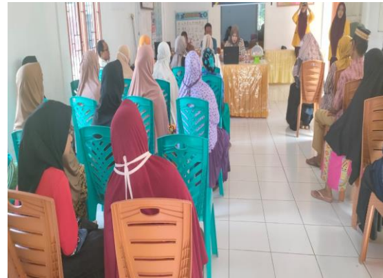
Gambar 4. Pemberian Edukasi Kepada Masyarakat di Kantor Desa Pacing

Program pengabdian masyarakat ini dimulai dengan Pemeriksaan kembali GDS untuk memastikan Kegiatan tepat sasaran dimana sebanyak 35 Masyarakat yang hadir dengan nilai rata-rata GDS 267 mg/dl. Setelah selesai pemeriksaan GDS selanjutnya masyarakat diarahkan untuk mengikuti edukasi tentang, Pemeriksaan dan perawatan kaki pada penderita Diabetes Mellitus.