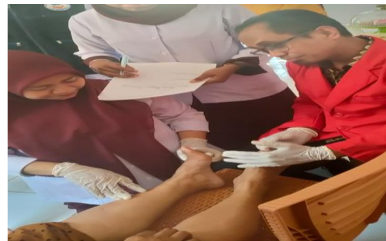
Gambar 5. Pemeriksaan Kaki Diabetik

Tahap Kedua dalam pelaksanaan Kegiatan ini adalah dengan mendemonstrasikan perawatan kaki dengan SPA kaki diabetic. Dimulai dengan Pemeriksaan fungsi sensori Semmes Weistein Monofilament test, dengan cara:tutup Mata Penderita, Lakukan Pemeriksaan secara acak pada titik secara bergantian selama 2 detik, dan Apabila terdapat luka pada kaki sebaiknya tidak dilakukan pemeriksaan. Selanjutnya adalah melakukan senam kaki diabetic dan SPA kaki Diabetik meliputi pembersihan, foot mask dan foot massage [7].