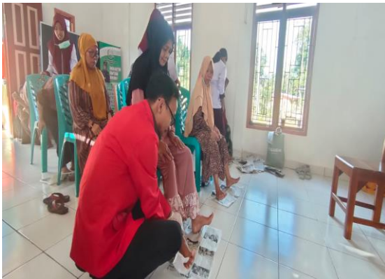
Gambar 6. Senam Kaki Diabetik