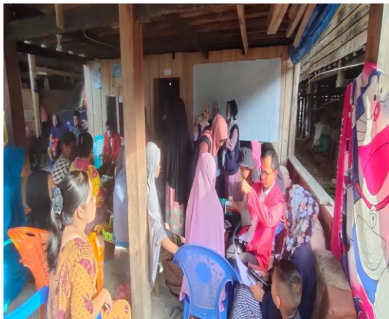
Gambar 3. Skrining kepada masyarakat yang dilakukan oleh Mahasiswa

Tahap selanjutnya adalah melakukan Skrining yaitu melakukan penyaringan kepada masyarakat yang memiliki risiko luka pada kaki dengan hasil Pemeriksaan GDS \geq 200 mg/dl. Skrining ini dilakukan oleh tim selama 5 hari sehingga diperoleh data dari 4 Dusun yang terdapat di Desa Pacing Kabupaten Bone sebanyak 35 orang Masyarakat yang di indikasikan menderita Diabetes Mellitus yang memiliki risiko luka pada kaki yaitu Dusun Bekku sebanyak 17 orang, Dusun Pacing sebanyak 5 orang, Dusun Sawangge sebanyak 4 orang, Dusun Matekko sebanyak 6 orang dan Dusun Mauleng sebanyak 3 orang.dengan hasil Pemeriksaan Rata-rata GDS \geq 282 mg/dl.