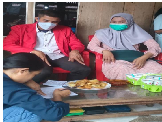
Gambar 2. Wawancara dengan Petugas UPTD Puskesmas Pacing.

Setelah dilakukan Survei lokasi selanjutnya melakukan wawancara terbuka dengan petugas penanggung jawab PTM UPTD Puskesmas Pacing terkait dengan kasus Diabetes Mellitus.