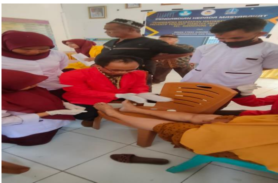
Gambar 7. Perawatan SPA Kaki Diabetik