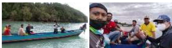
Gambar 4. Proses Monitoring oleh Tim Pengabdian dan Mitra

Pada gambar 4 dilakukan Monitoring perkembangan biorock dan rumah dilakukan setelah 2 minggu peletakan, tujuannya untuk melihat perkembangan baik dalam proses pertumbuhan karang maupun kondisi biorock dan rumah ikan itu sendiri, karena kondisi laut di sekitaran pulau warhu cukup tinggi gelombang dan arusnya, sehingga dikhawatirkan terjadi pergeseran biorock maupun rumah ikan.