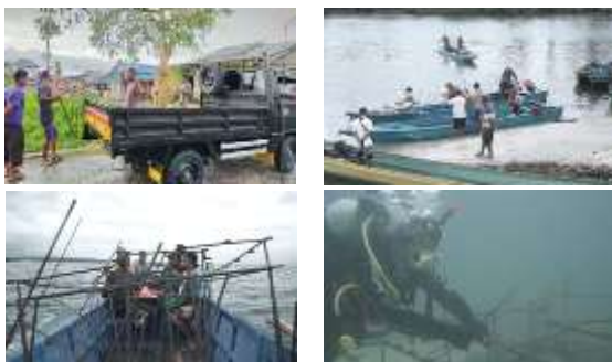
Gambar 2. Proses Pengangkutan, Peletakan dan Transplantasi Terumbu Karang pada Biorock

Hasil survei memutuskan lokasi peletakan bio-rock pada titik merah dan peletakan rumah ikan pada titik biru (gambar 2). Setelah 10 hari pekerjaan pembuatan bio-rock , maka kegiatan selanjutnya adalah dengan membawa bio-rock ke lokasi perairan pulau warhu.