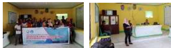
Gambar 5. Kegiatan Pelatihan dan Pendampingan

baru bagi nelayan, karena ikan-ikan yang ditemukan merupakan jenis-jenis ikan yang menjadi target tangkapan nelayan untuk lebih jelasnya dapat dilihat pada link video kegiatan pada channel youtube PDC https://www.youtube.com/watch?v=U9C2ENz2Asc . Demi menjaga dan melindungi lokasi ini dari bahayanya illegal fishing maka tim PKM Bersama mitra telah melakukan kegiatan kampanye kesadaran lingkungan serta penyuluhan bahaya illegal fishing untuk pemuda dan masyarakat, dengan harapan Kawasan ini akan benar-benar dijaga dan dikelola dengan baik untuk kesejahteraan nelayan baik saat ini hingga yang akan datang, selain itu juga dilakukan pelatihan dan pendampingan (gambar 5) manajemen organisasi dalam upaya meningkatkan fungsi dan peran mitra dalam menjaga lingkungan laut. Kegiatan ini sangat baik dilaksanakan karena terjadi peningkatan pemahaman mitra dalam menjaga dan melestarikan lingkungan laut.