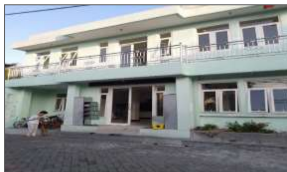
Gambar 1. Asrama Putri dan Asrama Putra

Para santri anak-anak yatim dalam kesehariannya melaukan kegiatan pesantren seperti Tahfidzul Qur'an, Nahwu, Shorof, kegiatan kewirausahaan di dalam pesantren serta pendidikan formal seperti SD, SMP, dan SMA/SMK dan mereka mengikuti Pendidikan formal di luar pesantren, di sekolah sekolah di sekitar pesantren. Pesantren ini memiliki ekstrakurikuler bahasa Inggris. Sejauh ini, anak-anak kurang termotivasi dalam mengikutinya karena menggunakan metode tradisional. Melihat kondisi tersebut, Para santri anak-anak yatim mendapat pelatihan Bahasa Inggris oleh tim pengabdian Universitas Dr. Soetomo. Pembelajaran Bahasa Inggris diberikan secara tradisional di mana tim pengabdian datang ke Pesantren Bismar Al- Mustaqin, memberi materi pelatihan Bahasa Inggris dasar di ruang belajar pesantren tatap muka seperti yang tampak pada gambar. Santri anak yatim ini belum familiar atau belum merasakan pembelajaran dengan media digital. Peserta didik, lebih menyukai belajar dengan menggunakan media dari pada pembelajaran satu arah [6][7]. Walaupun dikatakan berhasil model pembelajaran tatap muka dan tradisional ini, para santri belum fokus, belum percaya diri mengungkapkan praktek praktek yang diajarkan serta cenderung bergurau waktu proses pembelajaran.