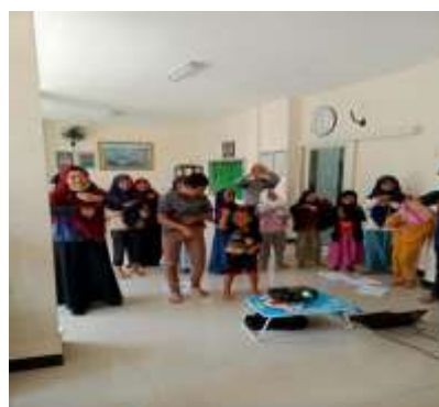
Gambar 2 Menirukan dansa digital kosa kata part of body, tim pengabdian mengarahkan santri