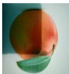
Gambar 3. Suasana Pelatihan dan Gambar Orange dalam tampilan digital