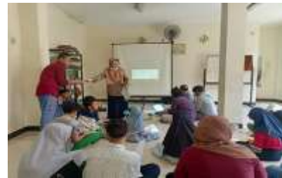
Gambar 5. Tayangan Wild Animals Game dan suasana pelatihan pada materi Game on Animals