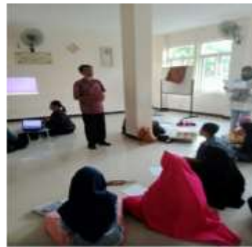
Gambar 4. Tayangan Animals dan suasana pelatihan pada materi Singing a song Animals