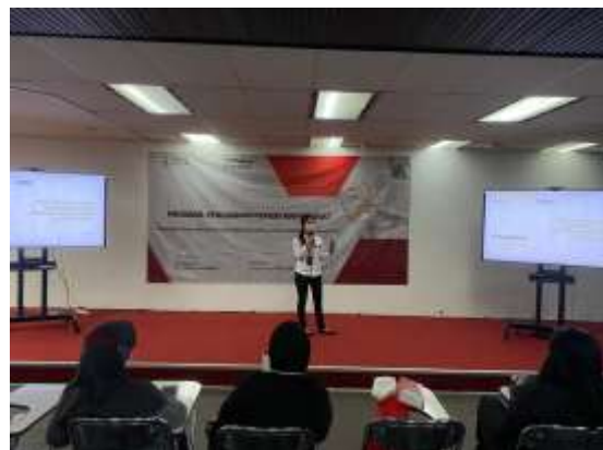
Gambar 3. Sosialisasi Green Marketing dan Digitalisasi Mareketing

produk dengan tujuan untuk melindungi produk dari cuaca, guncangan, dan benturanbenturan terhadap benda lain. Berikut adalah bukti kegiatan sosialisasi tren digital marketing dengan fokus green marketing.