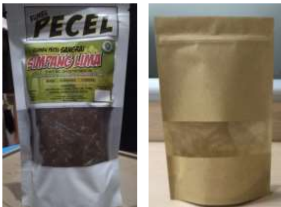
Gambar 5. Perubahan Kemasan Ramah Lingkungan untuk UMKM Bumbu Pecel “Mbok Yana” dari pouch plastik menjadi pouch berbahan kertas craft