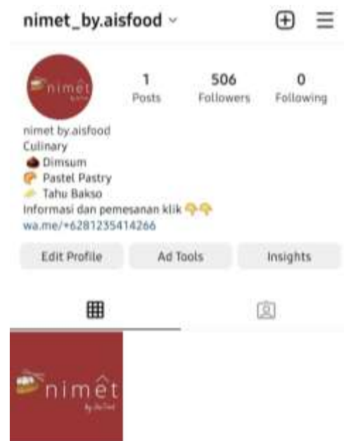
Gambar 7. Akun Instagram untuk UMKM Kuliner “Ais Food”

Digital marketing adalah metode pemasaran dengan memanfaatkan media digital. Pada pengabdian masyarakat ini kami memberikan pelatihan dalam pembuatan media sosial untuk melakukan pemasaran. Dalam pelatihan ini kami memilih UMKM yang sama sekali belum memiliki sosial media. Selain membuat media sosial berupa Instagram kami juga membelikan followers untuk Instagram UMKM tujuannya adalah meningkatkan kepercayaan calon konsumen. Karena jumlah followers akan memengaruhi kepercayaan calon konsumen bahwa toko online tersebut terpercaya karena sudah banyak konsumsn yang bergabung ( following ). Selain membuat akun media sosial dan memberikan followers nantinya tim pengabdian masyarakat kami juga akan melakukan pendampingan dalam mengelola konten pemasaran di Instagram tersebut. Berikut ini adalah akun media sosial yang kami berikan untuk UMKM :