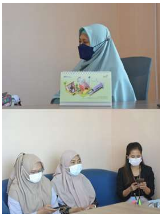
Gambar 2. FGD dengan Mitra

pemilik UMKM. Proses indept interview dan FGD, seperti terlihat pada gambar 2.