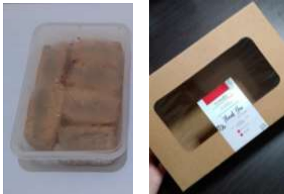
Gambar 4. Perubahan Kemasan Ramah Lingkungan untuk UMKM Kuliner “Ais Food” dari box plastik menjadi box berbahan kertas craft