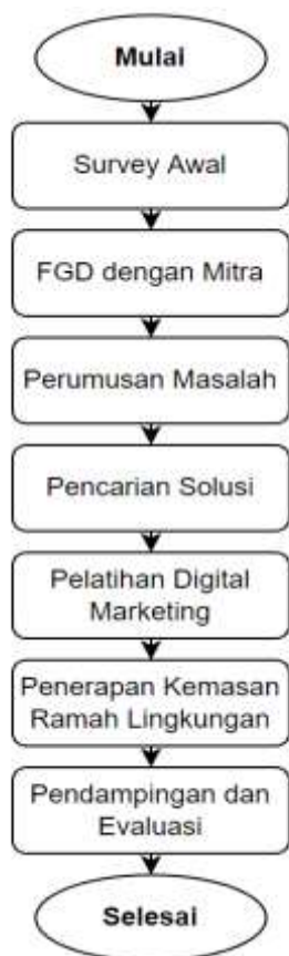
Gambar 1. Tahapan Pelaksanaan PKM