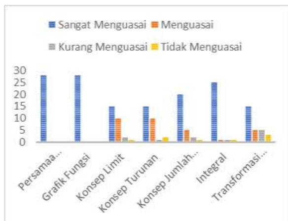
Gambar 6. Kemampuan Menggunakan Geogebra Sesudah Pelatihan

peserta mampu menggunakan software Geogebra dalam materi persamaan aljabar, grafik fungsi, konsep limit, konsep turunan, konsep jumlah rieman, arti integral dan memvisualisasikan materi Geometri seperti terlihat pada gambar 6.