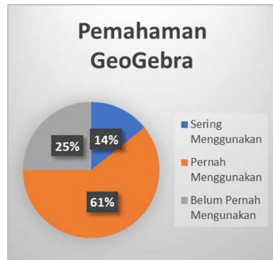
Gambar 4. Pemahaman Geogebra Peserta

menggunakan, 25% peserta pernah menggunakan, dan 61% peserta belum pernah menggunakan. Hal ini dapat disimak pada gambar berikut.