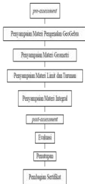
Gambar 3. Langkah-langkah Kegiatan PKM

Partipasi mitra/MGMP Matematika SMA Cimahi dalam kegiatan ini adalah