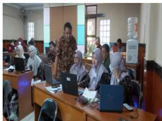
Gambar 2. Pelaksanaan Pelatihan

Tahap kelima, pelatihan dilaksanakan di SMA Negeri 5 Cimahi pada tanggal 25 Agustus secara tatap muka. Sesi pertama, dipaparkan solusi masalah integral dengan GeoGebra. Sesi kedua, praktik solusi masalah Integral dengan GeoGebra dipandu oleh ketua PKM yang dibantu anggota. Kegiatan tersebut dapat disimak pada foto berikut ini.