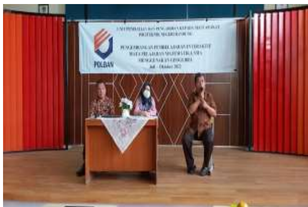
Gambar 1. Pembukaan Pelatihan

Kegiatan PKM ini dimulai pelaksanaannya di SMAN 2 Cimahi secara tatap muka pada tanggal 4 Agustus. Kegiatan Tahap kesatu diisi dengan acara pembukaan oleh Ketua MGMP Matematika SMA Cimahi, dilanjutkan oleh ketua PKM yang menjelaskan kegiatan pelatihan yang dapat disimak pada gambar berikut ini.