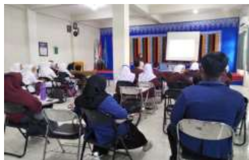
Gambar 1. Pembukaan Pelatihan Aplikasi Mendeley