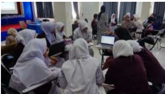
Gambar 5. Tim Memandu Mahasiswa Secara Berkelompok Praktik langsung Penggunaan Aplikasi mendeley