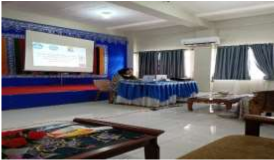
Gambar 4. Penyampaian Materi

Adapun kegiatan yang dilakukan pada pelatihan Mendeley ini dapat dilihat pada gambar berikut :