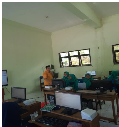
Gambar 3 Proses Pelatihan

Jika sudah berhasil login, User bisa mengakses beberapa menu yang ada di dalam website Pondok Pesantren Subulul Huda.