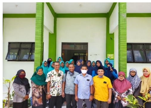
Gambar 4 Tim dan Peserta Pelatihan

Gambar 3 menunjukkan kegiatan proses pelatihan dan pendampingan aplikasi website Pondok Pesantren Subulul Huda Kembang Sawit Madiun yang diikuti oleh 20 peserta.