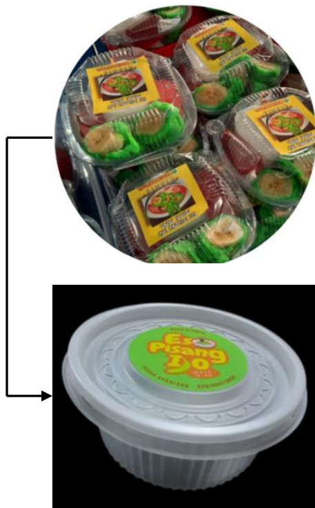
Gambar 4. Transformasi Kemasan Es Pisang Ijo “Mbak Nina” menggunakan Teknologi Oxo-biodegradable