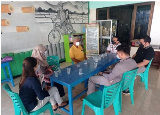
Gambar 2. Pelaksanaan FGD dengan Mitra

Guna mengetahui permasalahan yang dihadapi mitra kami mengadakan Focus Group Discussion (FGD) bersama ketua RW 06 Kelurahan Bulaksari serta ketua kelompok UMKM Bulaksari. Dari kegiatan ini diperoleh informasi para pelaku UMKM yang membutuhkan pedampingan karena kemasannya yang belum menarik. UMKM yang dipilih untuk mendapatkan pedampingan juga ditentukan berdasarkan omset terendah yang diperoleh. Gambar berikut ini menampilkan proses indepth interview dan FGD bersama mitra,