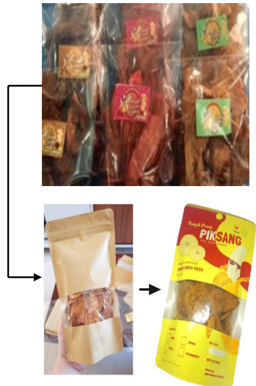
Gambar 5. Transformasi Kemasan Keripik Pisang Bu Ida “PIKSANG” menggunakan standing pouch kraft paper

Kemasan Keripik Pisang Bu Ida “PIKSANG” menggunakan kemasan standing pouch kraft paper dimana kemasan ini merupakan jenis kemasan fleksibel dan populer dan ramah lingkungan karena berbahan dasar kertas. Kemasan ini mudah didaur ulang, memiliki desain dengan tren terkini, food grade , dan aman untuk Kesehatan. Berikut adalah hasil transformasi kemasan dari kemasan lama berupa plastik menjadi kemasan yang lebih ramah lingkungan.