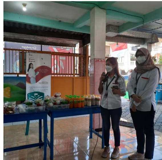
Gambar 3. Pelaksanaan Sosialisasi

adalah bukti kegiatan sosialisasi tren digital marketing dengan fokus green marketing .