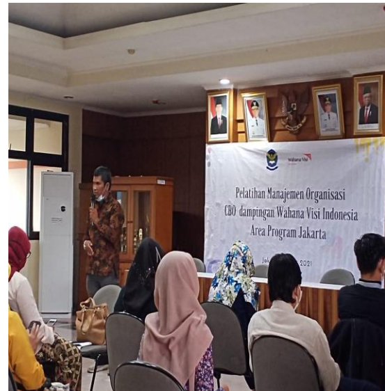
Gambar 1. Peserta Pelatihan Offline Pengabdian Masyarakat

Kegiatan pengabdian kepada masyarakat yang dilakukan secara online via aplikasi ZOOM Cloud Meeting. Sebelum dilaksanakan pelatihan maka diadakan pretest dengan menggunakan google form dimana dari 25 peserta yang mendaftar yang mengikuti sebanyak 24 peserta yang hadir dari 5 soal yang diberikan hasil jawaban yang benar adalah 56,6%. Namun setelah diberikan pelatihan dan materi maka hasilnya ada peningkatan menjadi 78,2%.