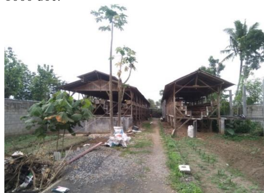
Gambar 1. Kandang Ayam Milik Mitra

Nurhimmim dengan tenaga kerja sebanyak 2 orang. Kandang ayam ini digunakan untuk memelihara ayam petelur. Kandang ayam ini memiliki dua kandang yang didirikan pada lahan seluas 19m x 85m dengan luasan setiap kandang sebesar 6m x 30m, seperti yang ditunjukkan pada Gambar 1. Kapasitas kandang peternakan ini sebesar 4000 ekor ayam dengan produksi telur sebanyak 220 Kg per hari. Selain kandang untuk ayam petelur, peternak Dua Putra ini juga memiliki kandang penetasan telur dengan kapasitas 1000 doc.