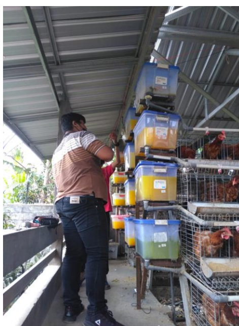
Gambar 3. Proses Pemasangan Dan Instalasi Peralatan