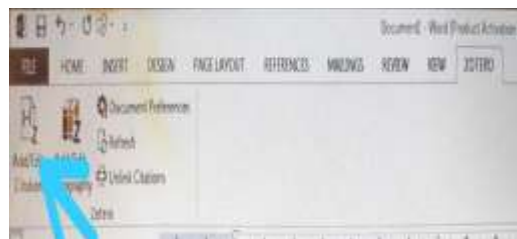
Gambar 3. Menu Add/Edit Citation