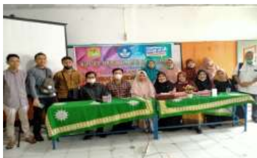
Gambar 1. Foto Bersama