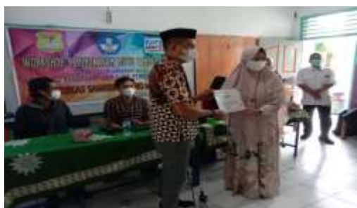
Gambar 2. Penyerahan Sertifikat Pelatihan