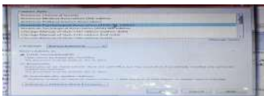
Gambar 6. Pilihan Style atau gaya selingkung