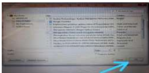
Gambar 5. file dan halaman kutipan