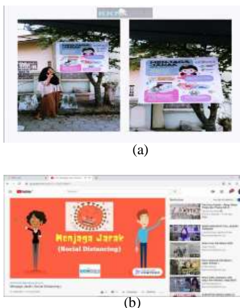
Gambar 3. Program Social Distancing, (a) Pemasangan MMT (b) Video Edukasi dan poster Social Distancing melalui Youtube

distancing merupakan salah satu usaha pencegahan dan pengendalian infeksi virus Corona dengan meminta orang sehat untuk membatasi kunjungan ke tempat ramai dan kontak langsung dengan orang lain. Program kerja ini berupa pendampingan melalui pembagian poster dapat dilihat pada Gambar 3 (a) video edukasi tentang penerapan social distancing dapat dilihat pada Gambar 3 (b) yang umum dilakukan, disebarluaskan melalui WAG RT/RW warga, taruna "IRMAGA" dan Youtube, serta pemasangan MMT di lingkungan, seperti didepan gerbang masuk gang dan pinggir jalan. Frekuensi pelaksanaan program adalah 6 x 4 jam pada Minggu ketiga. Pelaksanaan program ini bertujuan untuk meningkatkan pengetahuan dan pemahaman warga Perumahan mengenai penerapan social distancing yang dapat dilakukan warga guna mencegah penularan COVID-19. Program ini berhasil dilaksanakan dengan bertambahnya masyarakat paham hal-hal yang dapat dilakukan dalam menerapkan social distancing