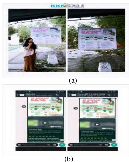
Gambar 4. Program Social Distancing, (a) Pemasangan MMT tentang Stay at Home (b) Video Edukasi dan poster Social Distancing melalui Youtube tentang Stay at Home

pemahaman warga Perumahan Pondok Majapahit dalam menerapkan stay at home bagi warga yang tidak memiliki kepentingan mendesak di luar rumah. Dalam melakukan pencegahan covid-19, pemerintah menganjurkan masyarakat untuk melakukan stay at home. Program kerja ini berupa pendampingan warga melalui pembagian video edukasi tentang hal-hal yang harus dilakukan bagi orang yang tidak sehat selama di rumah saja, video dapat dilihat dalam Gambar 4 (a) dan poster dapat dilihat dalam Gambar 4 (b) disebarluaskan melalui WAG RT/RW, karang taruna “IRMAGA” dan Youtube, serta pemasangan MMT tentang stay at home, seperti didepan gerbang masuk gang dan pinggir jalan. Selain itu, untuk mendukung program ini dilakukan pembuatan video menggunakan aplikasi TikTok tentang aktivitas yang dapat dilakukan selama di rumah saja agar tidak bosan bagi remaja-remaja, disebarluaskan melalui WAG karang taruna “IRMAGA”. Frekuensi pelaksanaan program adalah 6 x 4 jam pada Minggu keempat. Pelaksanaan program ini bertujuan untuk meningkatkan pengetahuan dan pemahaman warga Perumahan Pondok Majapahit mengenai pentingnya stay at home dan aktivitas positif yang dapat dilakukan selama di rumah saja, serta hal-hal yang harus dilakukan bagi orang yang tidak sehat selama di rumah saja. Program ini berhasil dilaksanakan dengan bertambahnya pengetahuan warga mengenai pentingnya stay at home dan mengetahui hal apa saja yang dapat dilakukan bagi orang yang tidak sehat selama di rumah saja