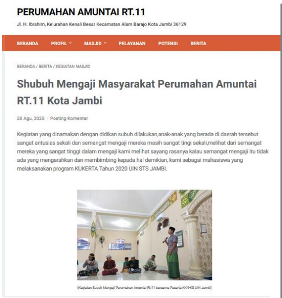
Gambar 7. Halaman Berita

Halaman perangkat RT berisi tentang susunan struktur organisasi perumahan Amuntai RT.11 berserta lampiran SK yang dapat didownload.