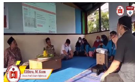
Gambar 9. Memberi pelatihan kepada pengguna dan pengelola website perumahan Amuntai RT.11

Setelah uji coba sistem tepatnya pada hari senin, 31 Agustus 2020 dilakukan sosialisasi sekaligus launching website perumahan Amuntai RT.11 di Aula Poskamling setempat.