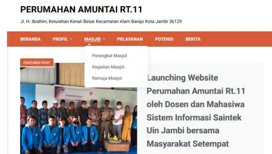
Gambar 4. Menu Profil Masjid

Sub menu Profil RT pada website terdiri dari Visi Misi, Sejarah, Perangkat, Kegiatan dan Fasilitas RT yang masing-masing mempunyai halaman ketika dikunjungi.