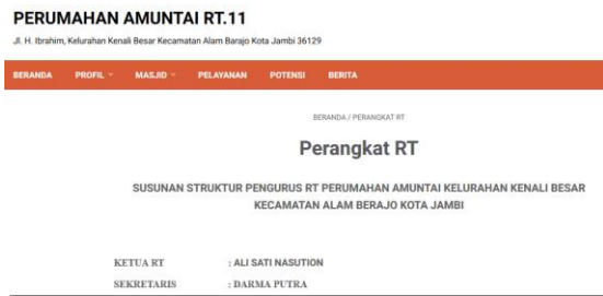
Gambar 6. Halaman Perangkat RT

Halaman perangkat masjid berisi tentang susunan struktur organisasi masjid perumahan Amuntai RT.11 berserta lampiran SK yang dapat didownload.