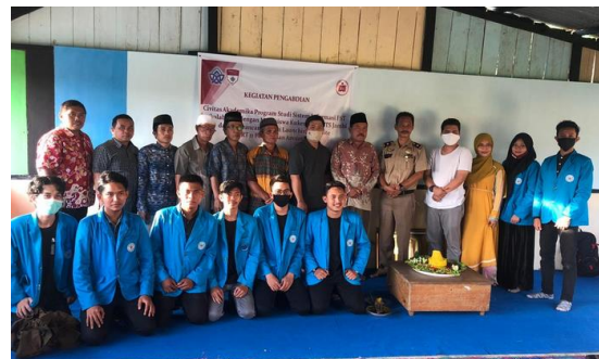
Gambar 8. Foto bersama launching webiste dengan ketua RT dan masyarakat perumahan Amuntai RT.11

Setelah uji coba sistem tepatnya pada hari senin, 31 Agustus 2020 dilakukan sosialisasi sekaligus launching website perumahan Amuntai RT.11 di Aula Poskamling setempat.