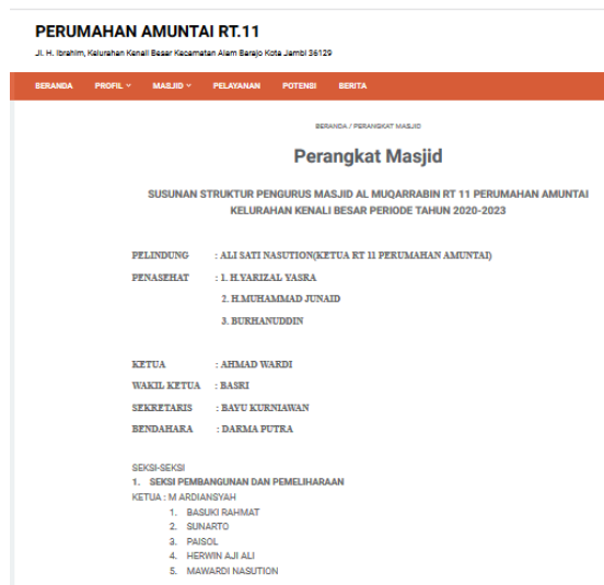
Gambar 5. Halaman Perangkat Masjid

Sub menu Profil Masjid pada website terdiri dari Perangkat Masjid, Kegiatan Masjid dan Remaja Masjid yang masing-masing mempunyai halaman ketika dikunjungi.