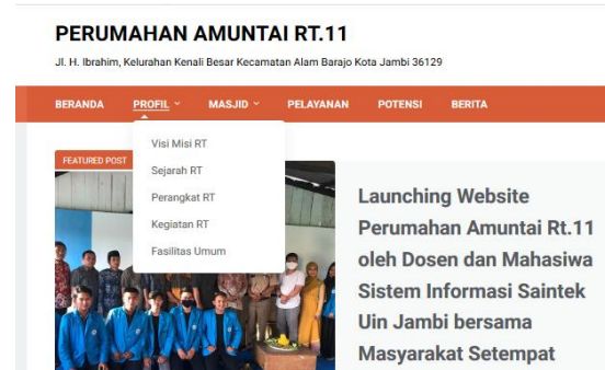
Gambar 3. Menu Profil RT

Halaman utama website perumahan Amuntai RT.11 terdiri dari menu Beranda, Profil RT, Profil Masjid, Pelayana, Potensi dan Berita.