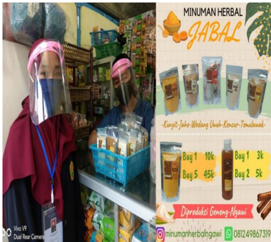
Gambar 4. Sarana pemasaran produk