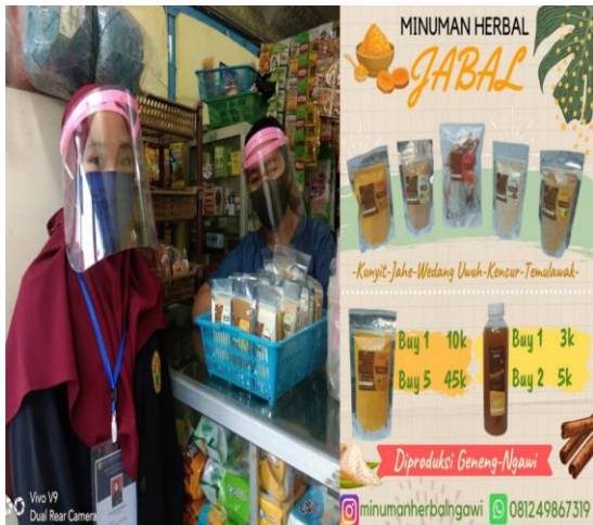
Gambar 4. Sarana pemasaran produk d. Pembuatan kelas KKN

Pembuatan kelas KKN salah satu kegiatan wajib yang harus dilakukan oleh mahasiswa KKN Back To Village 2020 dimana kelas KKN tersebut memberikan edukasi bersama masyarakat mengenai beberapa hal yang dapat dipaparkan. Pembuatan kelas KKN tersebut dilakukan dengan membuka kelas 4 kali yaitu 2 kali secara online dan 2 kali secara offline.