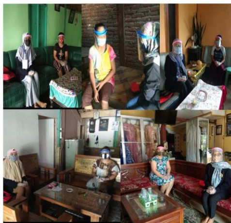
Gambar 2. Sosialisasi bersama masyarakat sasaran.

pelaksanaan kegiatan beserta peserta kegiatan. Tahap ini mahasiswa juga memberikan pelatihan K3 dan memberikan edukasi mengenai penyebaran Covid-19 serta pencegahannya.