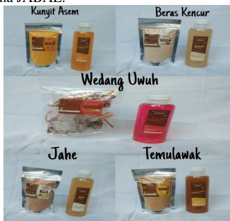
Gambar 3. Hasil Produksi Produk minuman herbal.

Pengemasan Produk Kemasan dapat didefinisikan sebagai seluruh kegiatan merancang dan memproduksi wadah atau bungkus kemasan suatu produk. Kemasan meliputi tiga hal, yaitu merk, kemasan dan label. Pengembangan desain produk perlu memperhatikan beberapa aspek, mulai dari perencanaan waktu hingga perancangan produknya [5]. Proses pengemasan dalam produk sangat diperlukan diantaranya dengan pengemasan produk dengan plastik standing pouch dan perlunya brand dalam produk juga diperhatikan. Produk minuman herbal diberi nama JABAL.