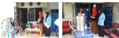
Gambar 7. Pemberian materi tentang kemasan dan perawatan alat vacuum frying

oleh mitra kerja selama penggunaan mesin penggorengan vakum dan produksi makanan keripik jamur.