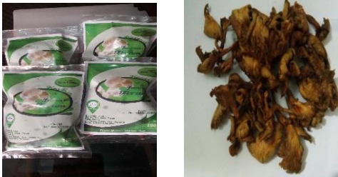
Gambar 6. kemasan keripik dan produk jamur

Disamping itu materi terkait dengan pemasaran, dimana disampaikan tentang beberapa persyaratan agar produk makanan olahan salak menjadi layak untuk dipasarkan dilihat dari kesehatan, legalitas usaha, kemasan yang menarik dan kiat – kiat memasarkannya. Output dari kegiatan pengabdian terkait dengan permasalahan diatas yaitu diperolehnya keripik jamur serta kemasan yang menarik. P.IRT dan kemasan produk yang menarik.