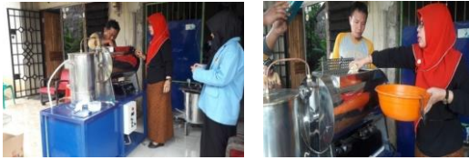
Gambar 5. Demo Pembuatan keripik jamur tiram

Disamping itu materi terkait dengan pemasaran, dimana disampaikan tentang beberapa persyaratan agar produk makanan olahan salak menjadi layak untuk dipasarkan dilihat dari kesehatan, legalitas usaha, kemasan yang menarik dan kiat – kiat memasarkannya. Output dari kegiatan pengabdian terkait dengan permasalahan diatas yaitu diperolehnya keripik jamur serta kemasan yang menarik. P.IRT dan kemasan produk yang menarik.