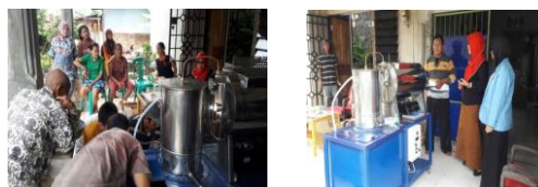
Gambar 4. Penyuluhan cara penggunaan Mesin Vacuum Frying

Metode teori dan ceramah dipilih untuk menyampaikan beberapa teori pendukung yang erat kaitannya dengan pelaksanaan kegiatan pengabdian masyarakat berupa teknis penggunaan mesin penggoreng vakum, teknik pengolahan jamur menjadi beberapa produk makanan, dan teknik pemasaran.