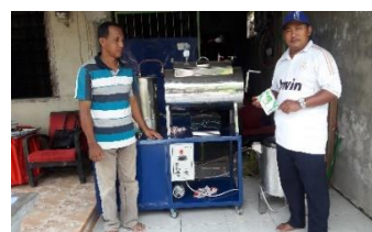
Gambar 3. Mesin Pengorengan Vakum 3,5Kg

Berdasarkan tujuan program pengabdian masyarakat ini maka kegiatan yang akan dilakukan berupa pelatihan ketrampilan produksi jamur tiram beberapa produk diantaranya keripik dengan berbagai rasa. Langkah awal yang dilakukan yaitu berupa pengadaan mesin penggorengan vakum dan penyediaan tempat produksi. Peralatan mesin dirancang berdasarkan tingkat produksi dan ketersediaan dana sehingga akan dapat diketahui dimensi mesin, jumlah kebutuhan bahan, rencana kekuatan mesin, rencana produktivitas mesin, dan permasalahan lain terkait dengan rencana pembuatan mesin tersebut. Berawal dari perancangan maka dapat dibuat mesin penggorengan vakum ( vacuum frying ) dengan kapasitas penggorengan 3,5 kg keripik jamur.