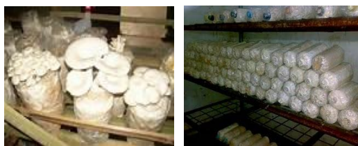
Gambar 1. Pembudidayaan Jamur Tiram dilokasi Mitra

pempek dan makanan khas Palembang lainnya.