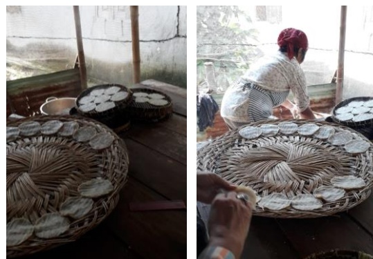
Gambar 3. Pengukusan dan Penyusunan untuk Dijemur

Tahapan pembuatan kemplang berikutnya adalah pemipihan dan pencetakan kemplang, pemipihan menggunakan penggilas ( rolling pin ) berbahan kayu dengan panjang 60 cm. Adonan yang telah tercampur rata dipipihkan sampai dengan dengan ketebalan 1 mm. Adonan dicetak menggunakan peralatan seperti tutup gelas atau teko, dengan ukuran 5 cm; 8,5 dan 11,5 cm. Hasil pencetakan pertama adonan kemplang cukup lembut, namun pada pencetakan kedua adonan menjadi lebih keras karena penambahan tepung pada lapisan atas dan tercampur dengan sisa tepung dimeja kerja.