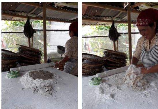
Gambar 2. Persiapan Pembuatan Kemplang

Pengadukan bahan dibuat atau diuleni pada meja kerja, pencampuran ikan dan tepung kanji diaduk langsung dengan tangan. Namun komposisi atau takaran yang baku antara ikan dan terigu sebagai bahan baku utama tidak ada, hal ini membuat kemplang mikro memiliki kekenyalan berbeda.