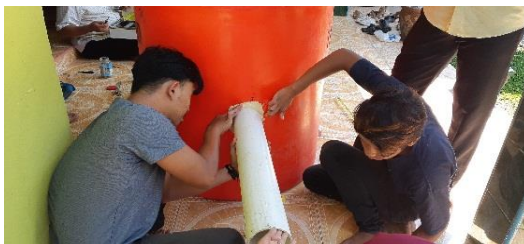
Gambar 4. Pemasangan pipa PCV 4 inch Memasang ball valve 4 inch pada pipa