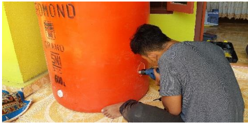
Gambar 3. Pembuatan Lubang pada Tangki