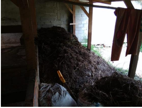
Gambar 1. Limbah Kotoran Sapi

Selain itu terdapat juga permasalahan lain yang dialami masyarakat yaitu :