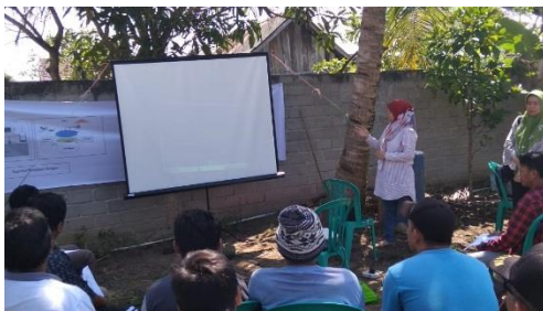
Gambar 6. Kegiatan penyuluhan tentang biogas

Kegiatan ini dilengkapi dengan penyuluhan kepada masyarakat dalam upaya memberikan edukasi dan wawasan tambahan mengenai fungsi dan keuntungan penggunaan biogas yang ditunjukkan pada Gambar 6.