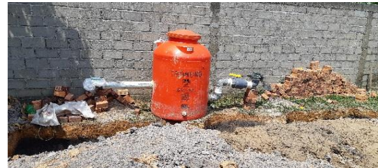
Gambar 5. Modifikasi digester biogas