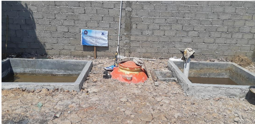
Gambar 7. Instalasi biogas