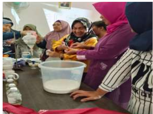
Gambar 3. Foto praktek pembuatan VCO