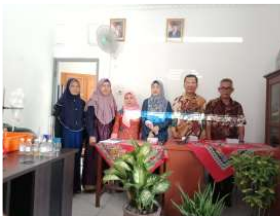
Gambar 1. Foto Tim Pengabdian bersama Lurah 32 Ilir

Pemilihan lokasi ini dikarenakan masyarakat disekitarnya mudah dikumpulkan dengan tingkat pendidikan yang memadai sehingga untuk menambah penghasilan keluarga, maka masyarakat di sini perlu diberikan penyuluhan teknologi tepat guna tentang pembuatan minyak kelapa secara fermentasi. Disamping itu teknologi pembuatannya yang cukup sederhana dan mudah dipahami serta prosesnya tidak menimbulkan limbah yang membahayakan, apalagi media cainya dapat dipakai berulang kali sebagai starter pada pembuatan minyak tahap berikutnya,