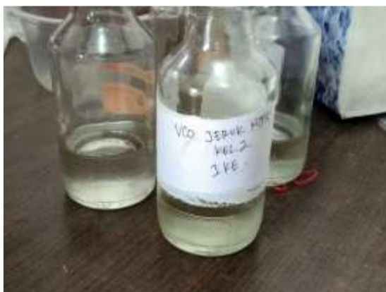
Gambar 4. Foto produk VCO

Sebagai indikator keberhasilan, minimal 70% dari peserta yang ditunjuk dapat menjawab pertanyaan atau mendemonstrasikan keterampilan pembuatan VCO. Disamping itu yang menjadi indikator keberhasilan lainnya adalah banyaknya warga yang mampu membuat VCO secara industri rumah tangga.