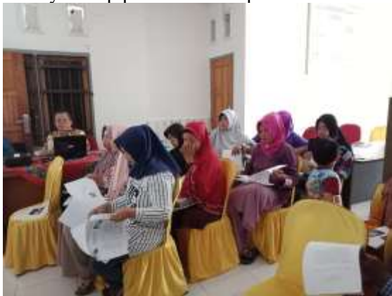
Gambar 2. Foto Ceramah Pembuatan VCO