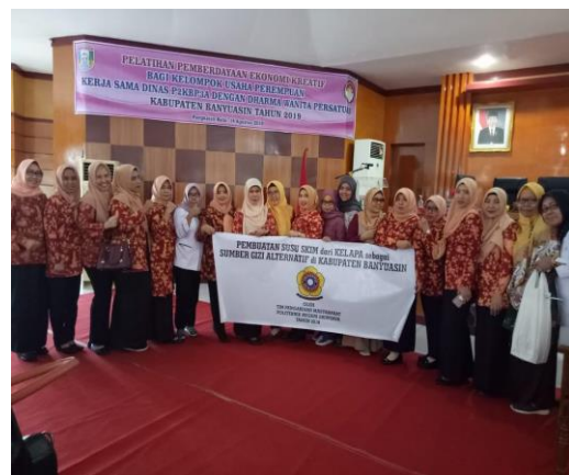
Gambar 5. Foto Bersama