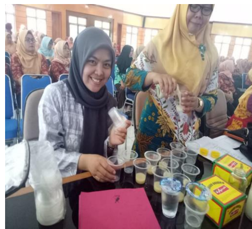
Gambar 4. Pengujian Produk