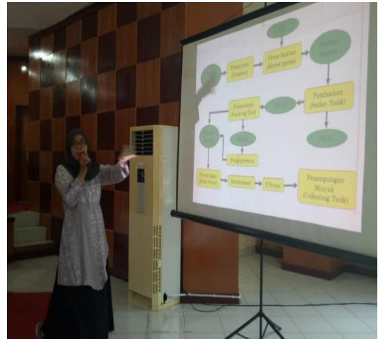
Gambar 3. Pemaparan Metodologi