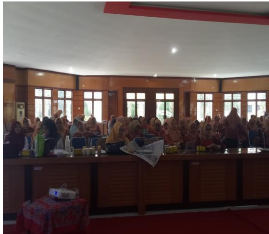
Gambar 1. Peserta Pendampingan