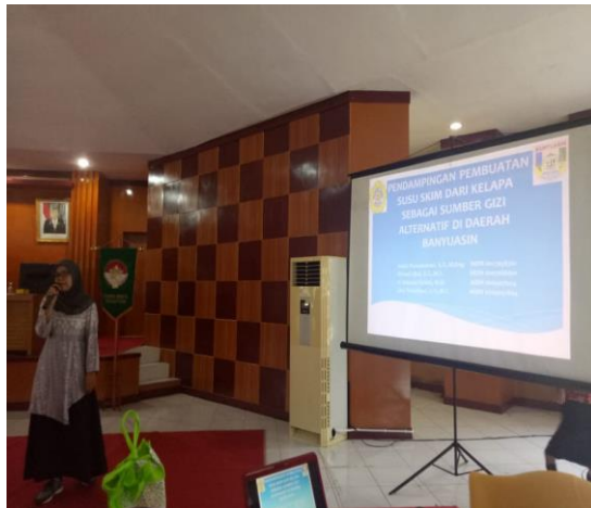
Gambar 2. Pemaparan Materi