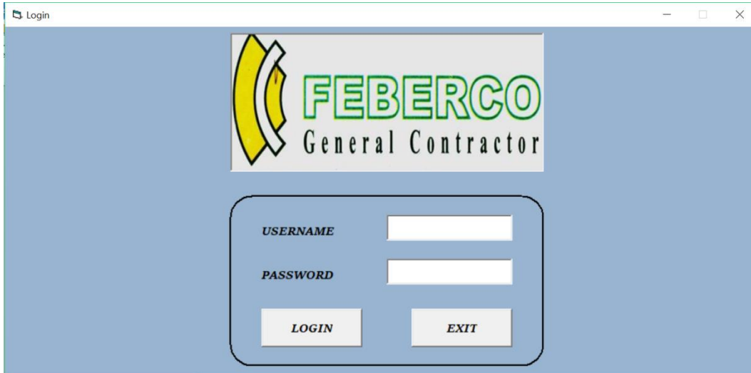
Gambar 3.2 Menu Login