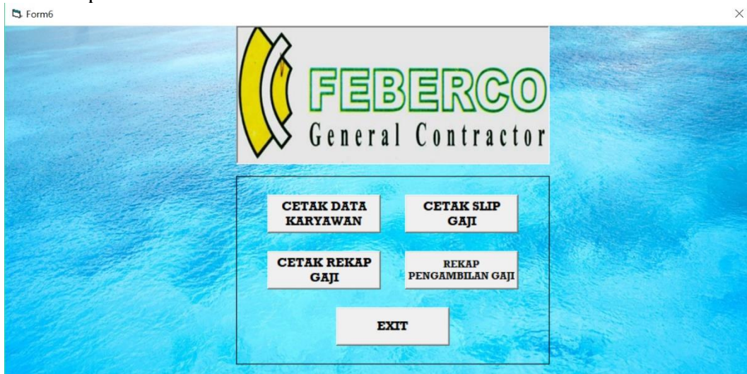
Gambar 3.4 Form Menu Laporan

Pada form ini, yang ada di database hasil dari form-form yang telah diisi sebelumnya, terdapat 3 pilihan :