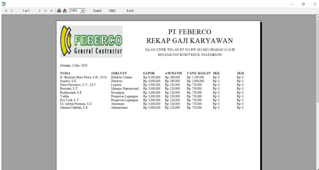
Gambar 3.7 Formulir rekap gaji

c. “Cetak Rekap gaji” yang fungsinya langsung mencetak rekap gaji pada PT Feberco Palembang.