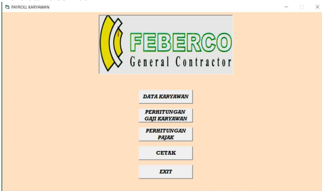
Gambar 3.3 Form Menu Utama

Jika administrator benar memasukkan data pada menu login, maka muncul tampilan menu utama berikut.